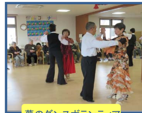
夢のダンスボランティア