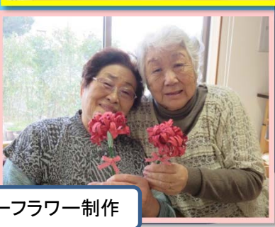
ペーパーフラワー制作