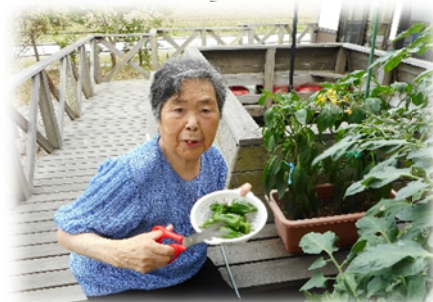
毎日、手入れしています

プランターに植えた トマト、きゅうり、 ピーマンが大豊作で す。毎日楽しく収穫 しています。