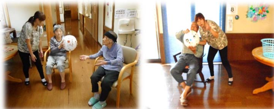
スタッフと一緒に汗を流しました

体操やゲームなど一人ひとりに合わせて行い今月は「バスケット」で盛り上がりました。