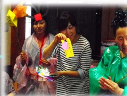
皆で短冊に願いを書きました

織姫と彦星に扮した職員が、手作りの衣装をまわると会場が一気に盛り上がり、七夕会がスタートしました。紙芝居で七夕の由来を知り、さっそく短冊に願い事を書きました。短冊の一枚一枚が読み上げられ「みんな元気で過ごせますように」…一番多かった願い事です。最後に笹の葉に願いを込めて七夕の歌を全員で合唱しました。今夜は、天の川がきれいに見えて、「織姫と彦星が会えるといいね」と思いを寄せる入居者様が印象的でした。