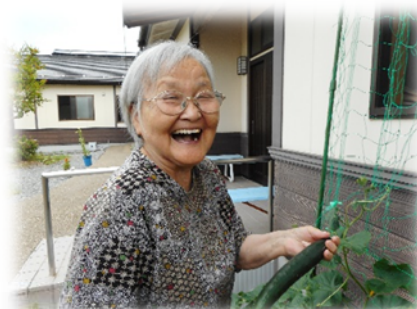
きゅうり、とれたよ!!

プランターに植えた トマト、きゅうり、 ピーマンが大豊作で す。毎日楽しく収穫 しています。