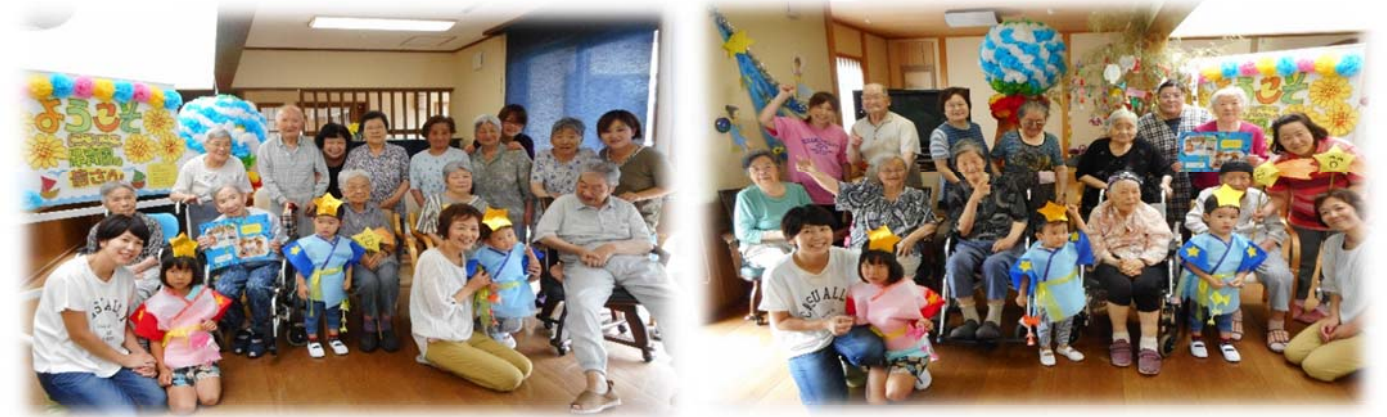
かわいい園児のみんなとハイポーズ