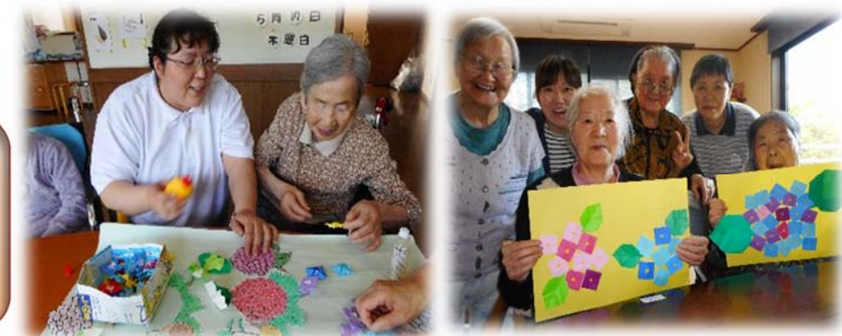
あじさいの花がきれいに咲いたよ

季節に合わせた作品を作ります。今月は「あじさい」を折り画用紙に貼りました。きれいでしょ!