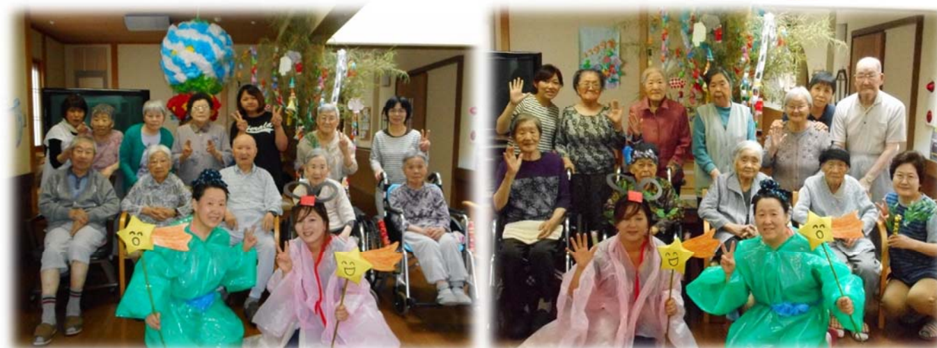
七夕飾りの前で織姫、彦星との記念撮影