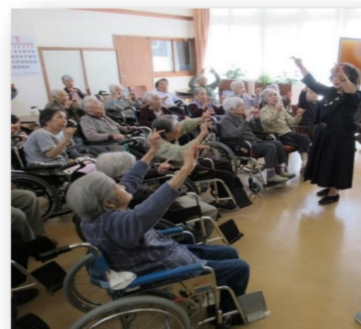
ピアノに合わせて体操しています