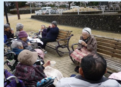
お茶を飲みながら休憩