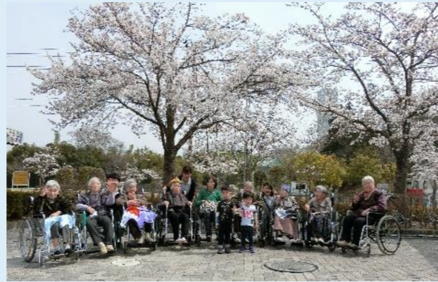
満開の桜の前で園児と一緒に記念撮影