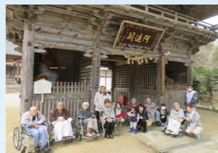
不動尊公園での1枚