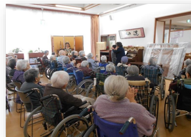
ピアノに合わせて歌を楽しみます